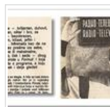
Jesen 1985 - Minimaks / Moj recept: Prvo za sebe kažem da ...